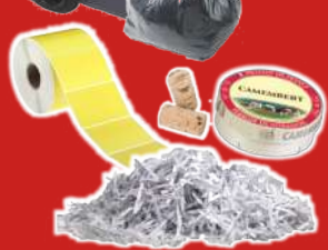
Papier déchiqueté, Photos, Papier peint Bobines, Éléments en bois