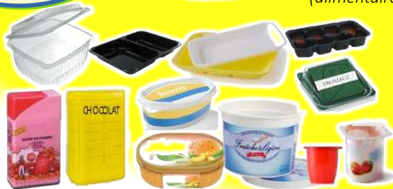
Pots et Barquettes