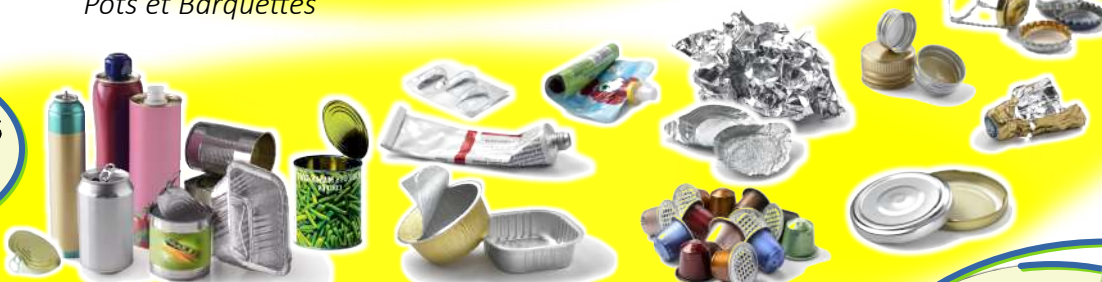
Aérosols, conserves, canettes, dosettes en aluminium, papier aluminium, opercules, capsules