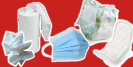
Masques, Essuie-tout, Lingettes Mouchoirs et serviettes en papier, Protections hygiéniques, Couches