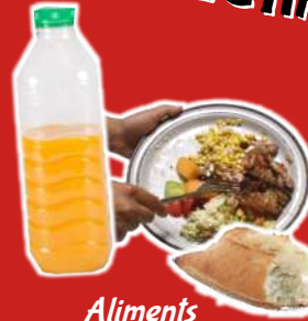
Aliments Emballages non vides