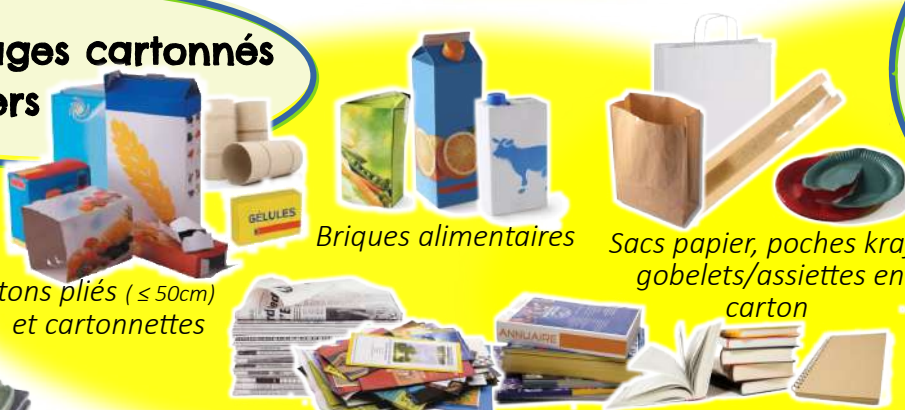
Cartons pliés (< 50cm) et cartonnettes