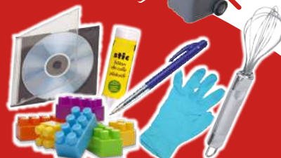
Objets en plastique ou en métal* (*cf. éléments repris en déchetterie)