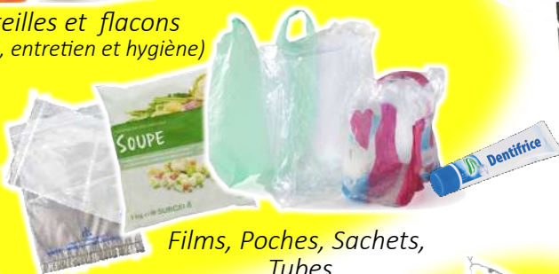
Films, Poches, Sachets, Tubes