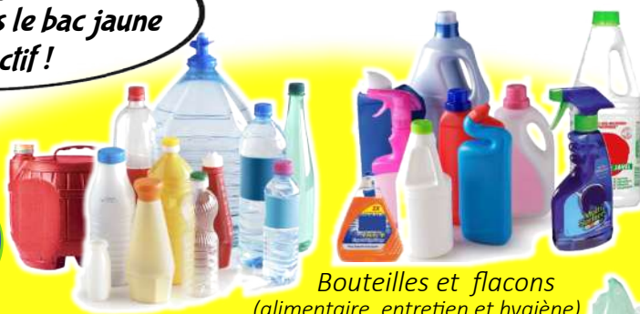
Bouteilles et flacons (alimentaire, entretien et hygiène)